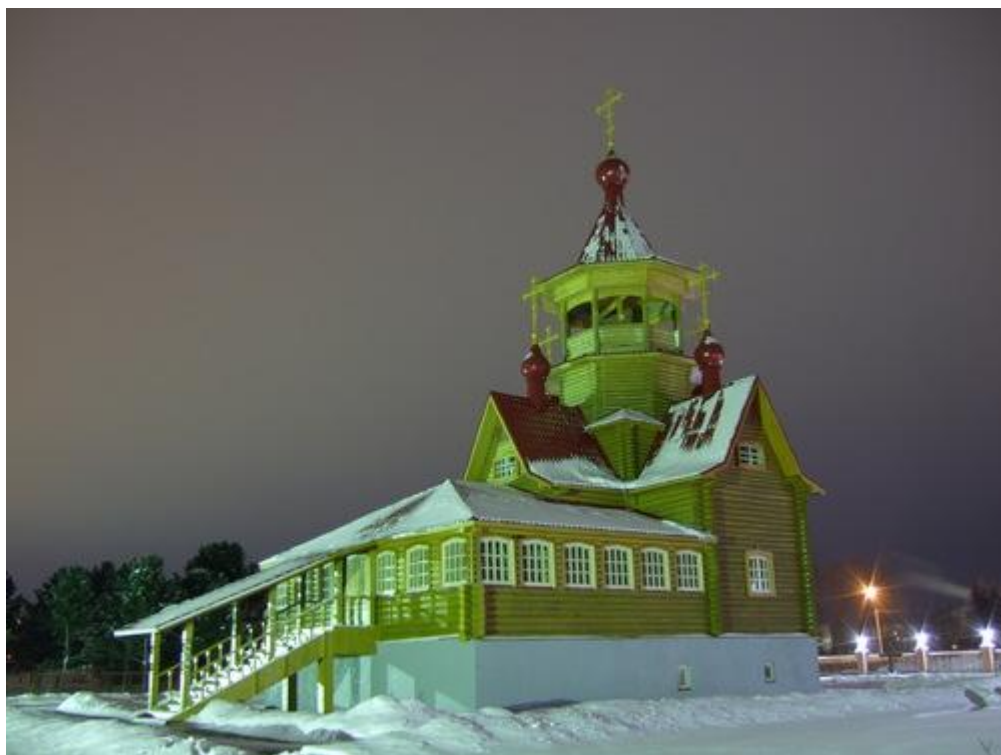
Храм Св. Игнатия Брянчанинова. St. Ignatiy Bryanchaninov church, Gryazovets

Камень в центре города на месте расположения бывшей церкви.